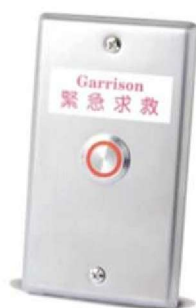
二段式開關 (帶燈型)