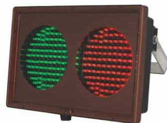
LK-104LS (小型 LED 燈箱)