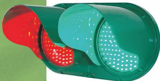
LK-104L (LED 燈箱)