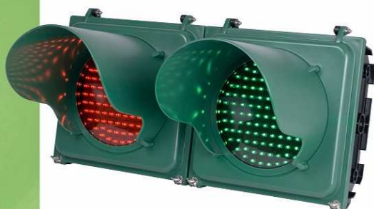
LK-104LM (中型 LED 燈箱)