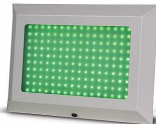
LK-104PS (平板雙色 LED 燈箱) LK-104PS(ST) (平板雙色 LED 燈箱)