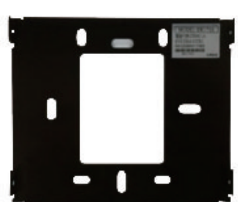
EH2100-A 壁掛架 (金屬材質)