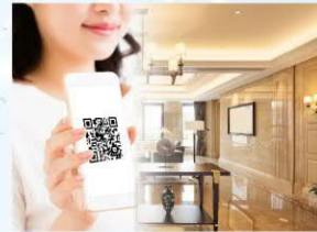
套房飯店 租賃/訪客管理