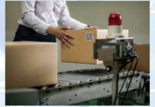
製程 控管/履歷/盤點