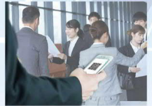
活動會議 報到/實聯制