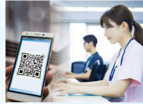
人員 門禁/考勤/點名