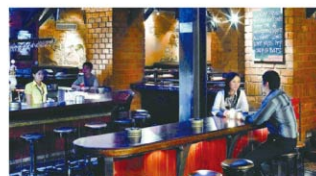
餐廳 / 飯店 / 美食街