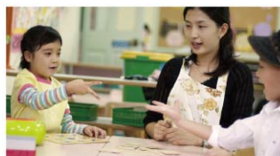
各級學校 / 補習班 / 安親班