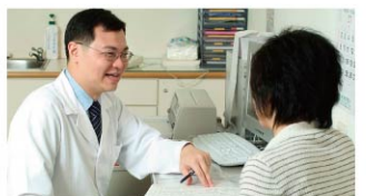
醫療單位 / 美容機構