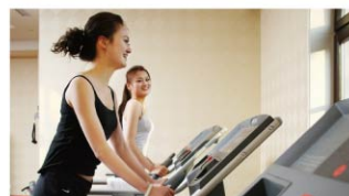
健身房 / 韻律教室