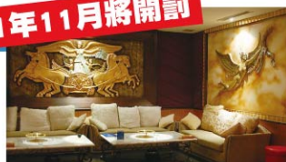
KTV / 電影院 / 網咖

《室內空氣品質管理法》規定，各級學校、政府機關、飯店、餐廳、KTV、便利商店、兒童遊樂場所、醫療場所、老人或殘障照護場所、展覽場所、辦公大樓、地下街、大眾運輸工具及車站等室內場所，需定期接受檢查，檢查不合格且未在期限內改善者， 可處新臺幣五萬元以上二十五萬元以下罰鍰 ，並再命其限期改善；屆期仍未改善者，按次處罰；情節重大者，得限制或禁止其使用公告場所，必要時，並得命其停止營業。