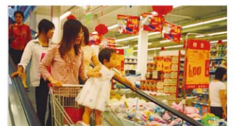
量販店 / 超市 / 百貨公司