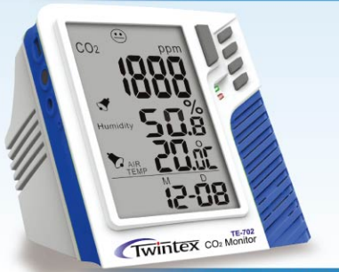
▲TE-702 / TE-702D