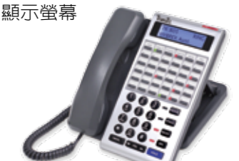
IP38-61A IP Key Phone