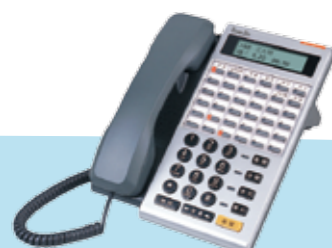
DK6-36DCB(BL) 36K 中文背光/藍芽耳機 DK6-36DC(BL) 36K 中文背光 DK6-36D(BL) 36K 英文背光