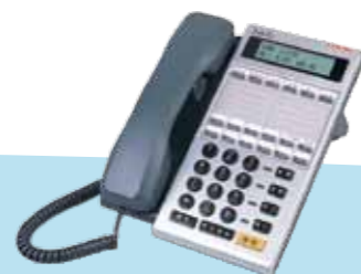
DK6-12DC(BL) 18K 中文背光 DK6-12D(BL) 18K 英文背光