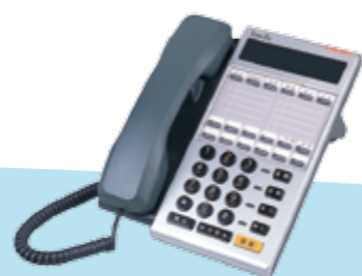
DK6-12S 18K 標準型