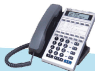
IP37-62A 中文背光 IP Phone