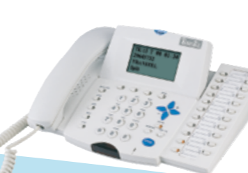
DK2-21(DSS 22) 中文64字元總機電話