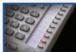
▲可程式鍵具有雙色燈