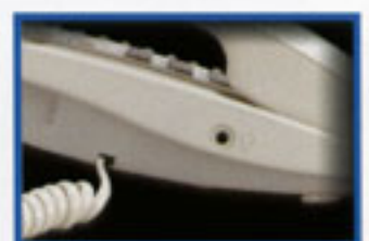
▲外接頭戴式耳機插孔