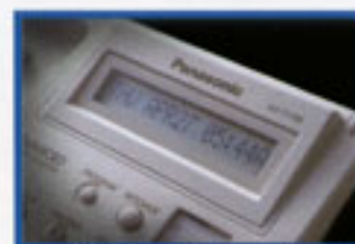
▲16字元大型液晶顯示