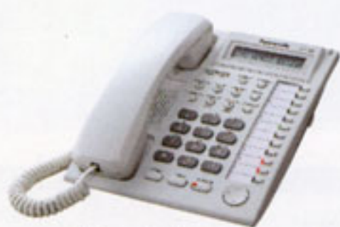
KX-T7730* 顯示型、免持聽筒對講話機